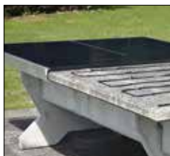
Erste Stufe der Sanierung: Eine neue Plattenhälfte ist montiert