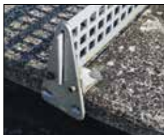
Rauhe, unebene Spielfläche eines alten Betontisches